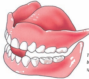
Tanden en kiezen zijn belangrijk voor het kauwen, spreken en het uiterlijk

Als u in de spiegel kijkt, moet u waarschijnlijk erg wennen. Uw mond is nu een maal een belangrijke blikvanger en die is veranderd. Neem een paar dagen de tijd om te wennen en beoordeel pas dan hoe u er met uw nieuwe tanden en kiezen uitziet.