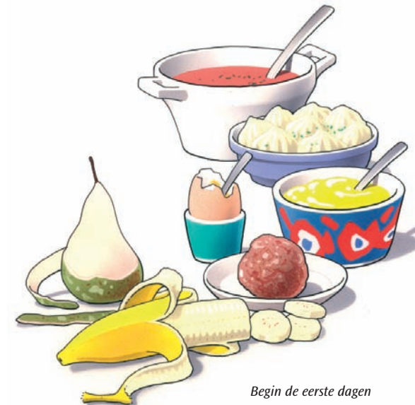
Begin de eerste dagen met zacht voedsel

Eten met uw nieuwe kunstgebit is wat onwennig. Zeker in het begin zult u voorzichtig aan doen. U ervaart zelf het beste wat wel en niet kan. Neem de eerste dagen zacht voedsel, zoals puree, gehakt en zacht fruit. Probeer enkele dagen daarna een stukje vis en een aardappel. Weer later kunt u voedsel eten zoals vlees of een appel. Stukken afbijten kunt u met een kunstgebit beter niet doen. Snijd uw voedsel daarom in stukjes en kauw rustig en gelijkmatig met uw nieuwe kunstkiezen. Neem daarbij aan beide zijden een stukje voedsel in de mond. Neem er iets meer tijd voor dan dat u gewend was.