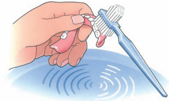
Reinig uw kunstgebit na iedere maaltijd

Uw kunstgebit is nu nog nieuw en mooi. Dat wilt u natuurlijk graag zo houden. Daarom moet u, net als bij eigen tanden en kiezen, uw kunstgebit verzorgen. Als u het niet regelmatig schoonmaakt, blijven er voedselresten achter. Zowel op uw kunstgebit als eronder. Als u die niet verwijdert, kan uw tandvlees op den duur gaan ontsteken. Reinig uw gebit daarom zorgvuldig na iedere maaltijd. Gebruik een speciale protheseborstel, bijvoorbeeld van Lactona of Oral-B, en water om etenresten goed te verwijderen. Gebruik géén tandpasta. Die kan te veel schuren. Een schoon kunstgebit voelt altijd glad aan. Laat uw gladde gebit tijdens het reinigen niet uit uw handen glippen. Het zal kapot gaan. Vul voor de zekerheid eerst de wasbak met water en reinig uw gebit daarboven.